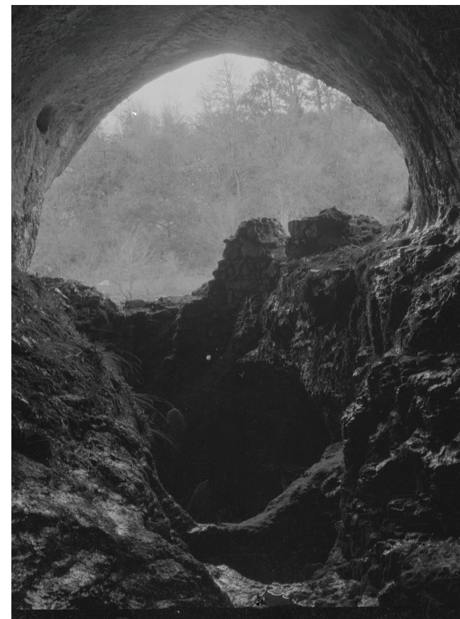
Ulaz u pećinu Muževa hižica

Svoj speleološki rad Josip Poljak je okrunio disertacijom Pećine hrvatskog krša . Obranio ju je 1. travnja 1922. godine na ondašnjem Geografskom zavodu Mudroslovnog fakulteta kod prof. Milana Šenoe, sina poznatog književnika Augusta Šenoe. Rad je ocijenjen ocjenom "odličan". Osim zbog vrijednih znanstvenih spoznaja iz područja speleologije i geomorfologije krša, značaj njegovog djela je i u činjenici da se radi o prvim regionalnim speleološkim istraživanjima na tlu Hrvatske.